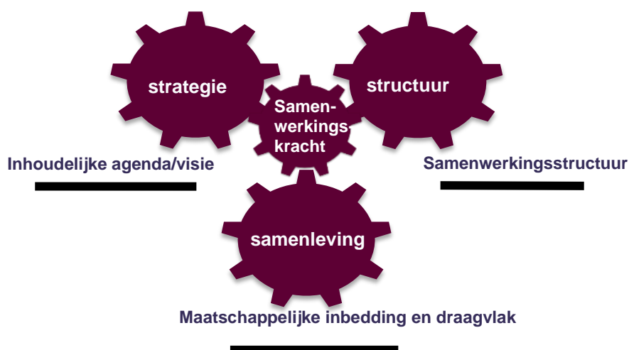
Afbeelding 1: 3S-model: samenwerkingskracht

Volgens het 3S-model (gebaseerd op praktijkervaringen met succesvolle samenwerking) is de samenhang tussen de drie S'en van essentieel belang voor samenwerkingskracht.