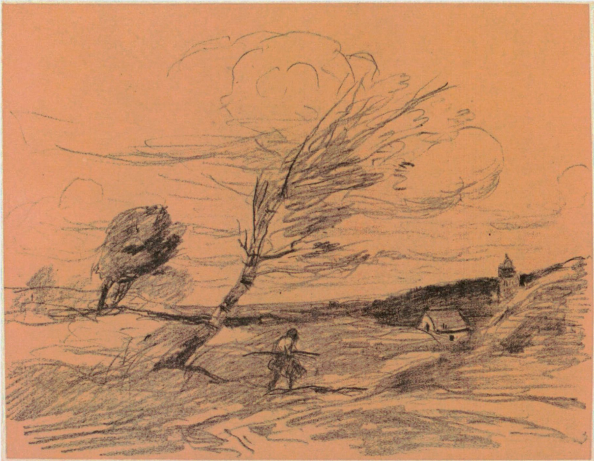
'De windstoot' (Le coup de vent) van Jean-Baptiste Corot (1871)