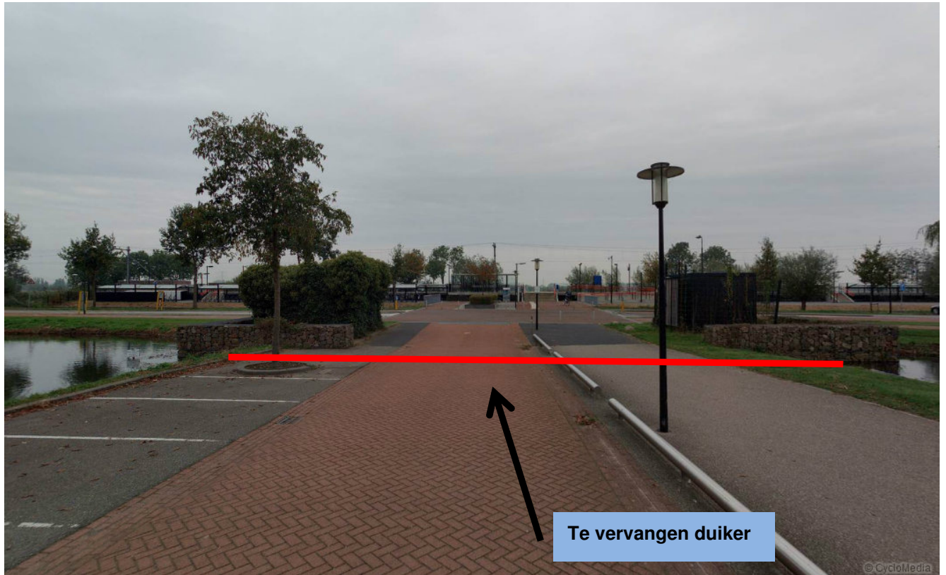
Foto huidige situatie Knobbelzwaan