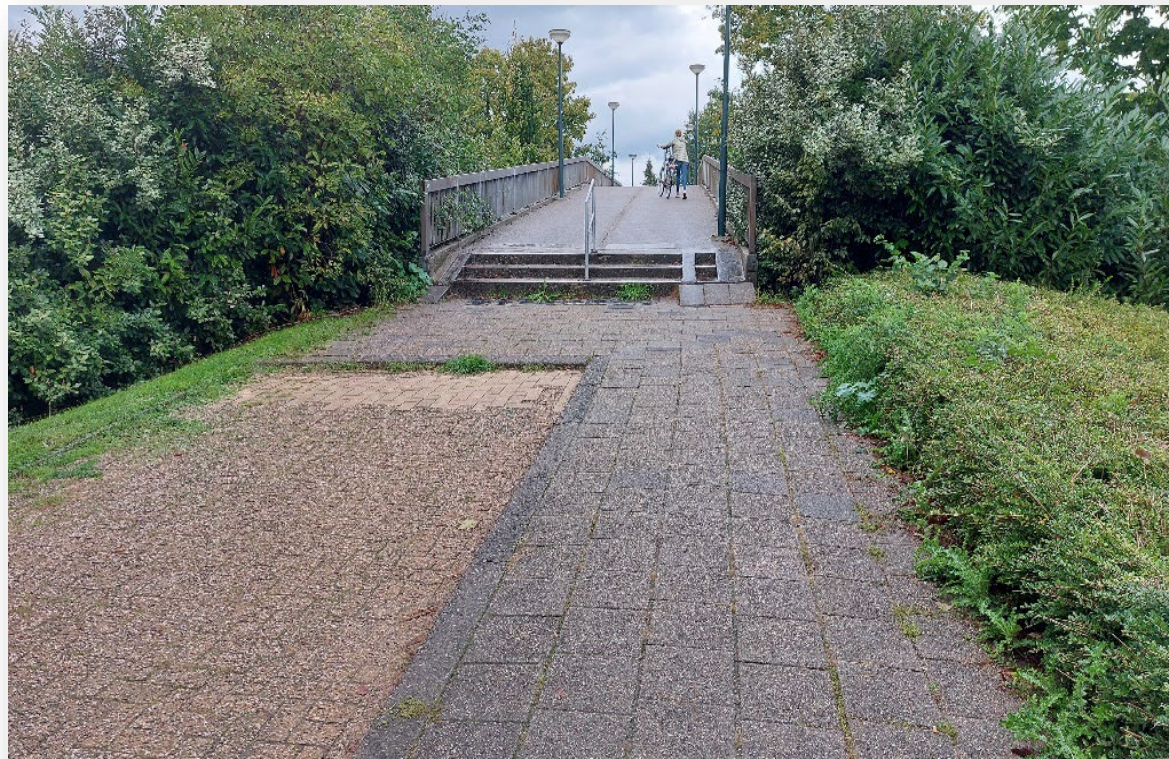
Marsstraat, trapjes, stevig hellend