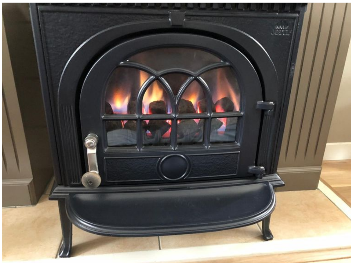
Jannies 'nephaard' op gas.

belde aan. Na een snauw werd de deur in zijn gezicht 'dichtgeflikkerd'. Sindsdien is de beer los.