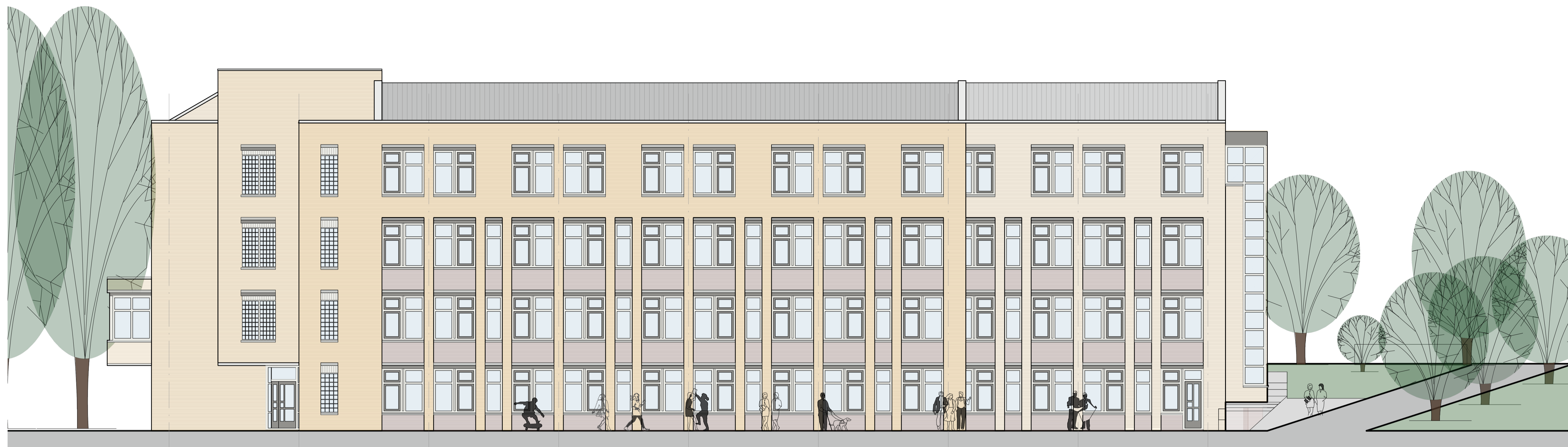
zuidgevel - bestaand