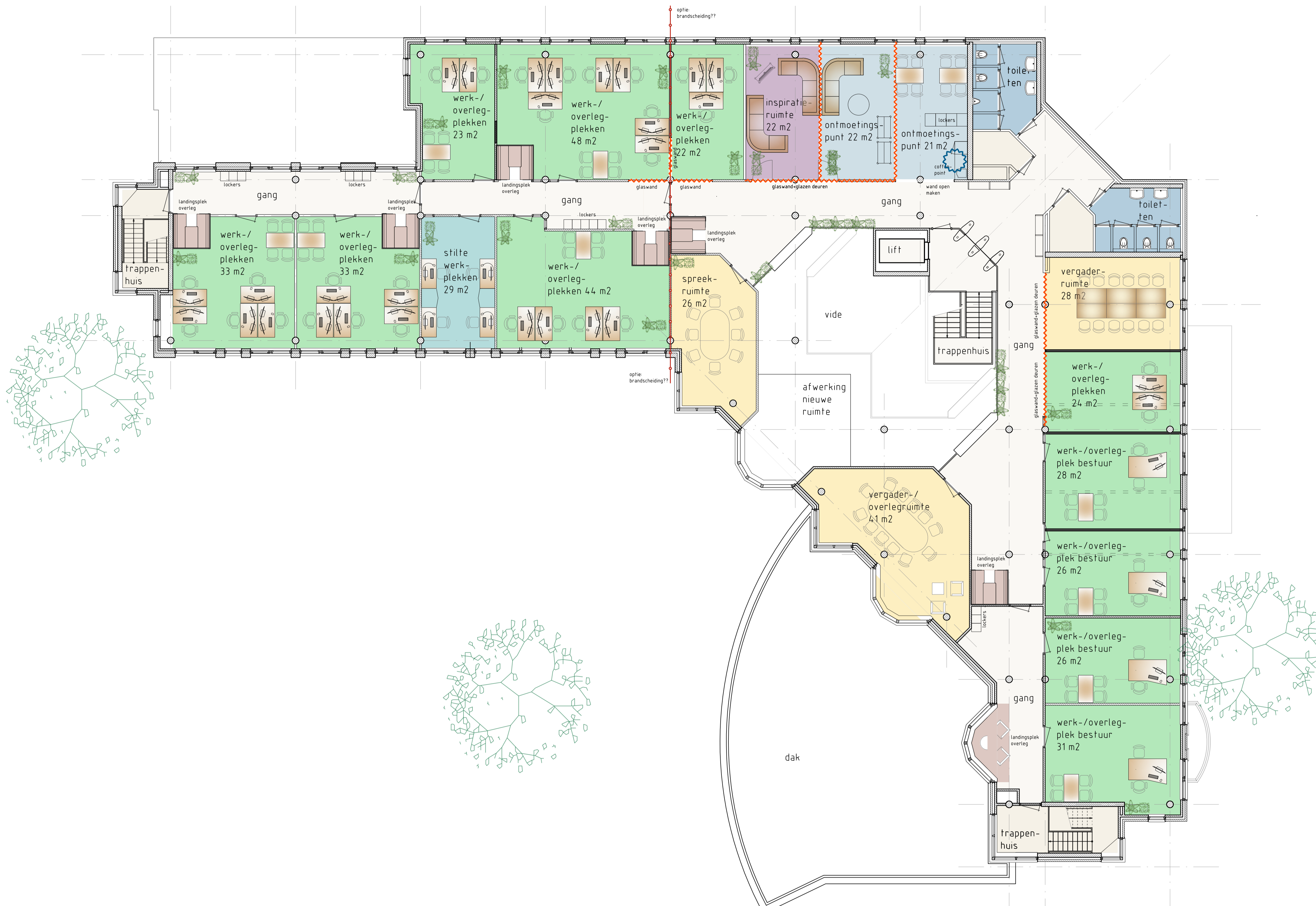
2e verdieping - variant 3