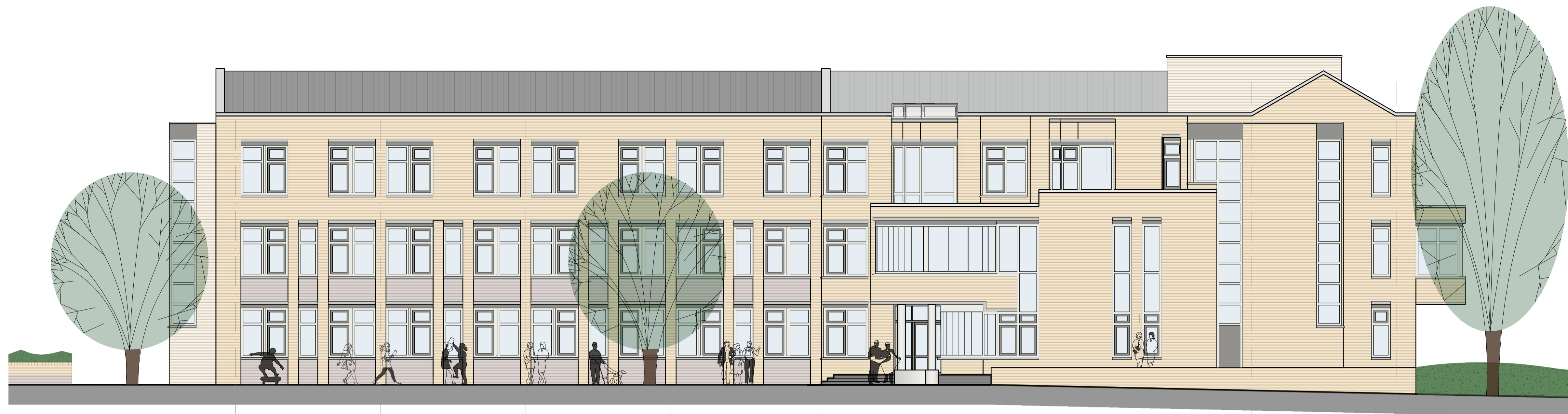
noordgevel - bestaand