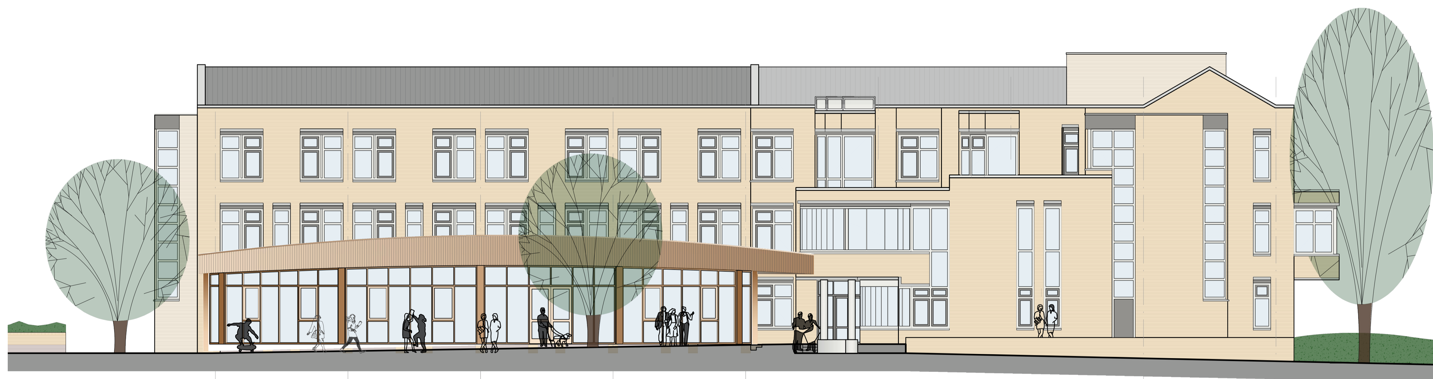
noordgevel - variant 3