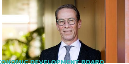
ECONOMIC DEVELOPMENT BOARD