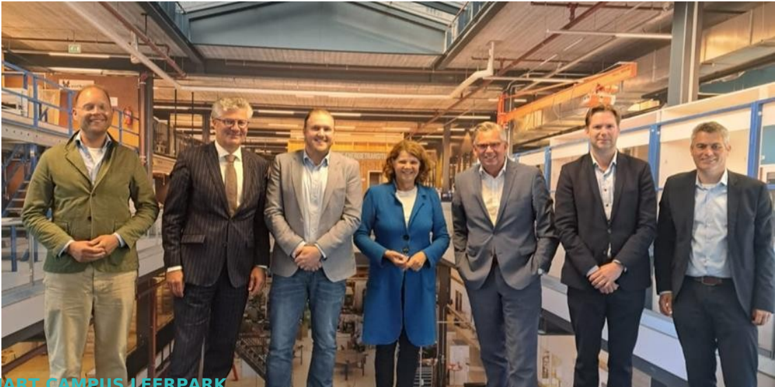
SMART CAMPUS LEERPARK