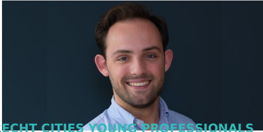
DRECHT CITIES YOUNG PROFESSIONALS