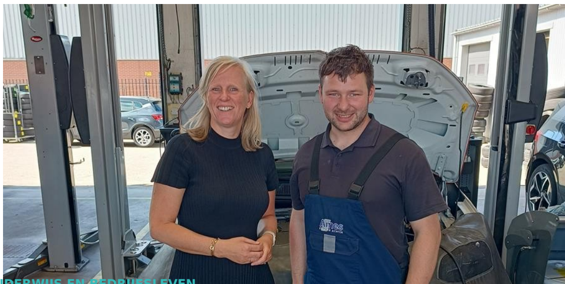
ONDERWIJS EN BEDRIJFSLEVEN