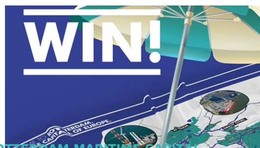
ROTTERDAM MARITIME CAPITAL

Impact Day Drechtsteden vol inspiratiesessies