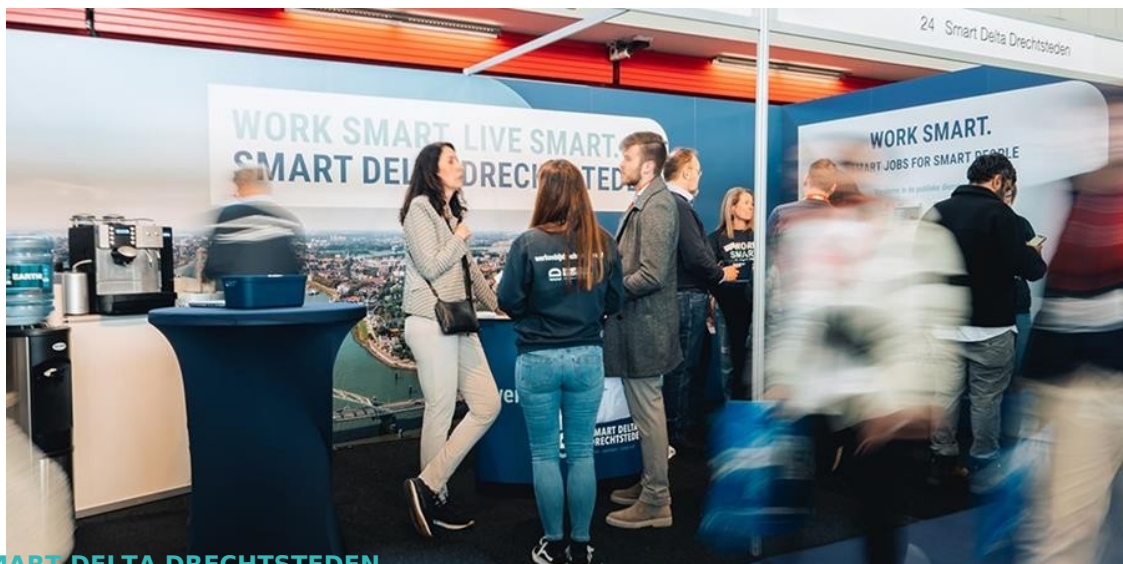
SMART DELTA DRECHTSTEDEN

Superjacht Jeff Bezos (Oceanco) verlaat Nederland voor laatste testen | Schuttevaer