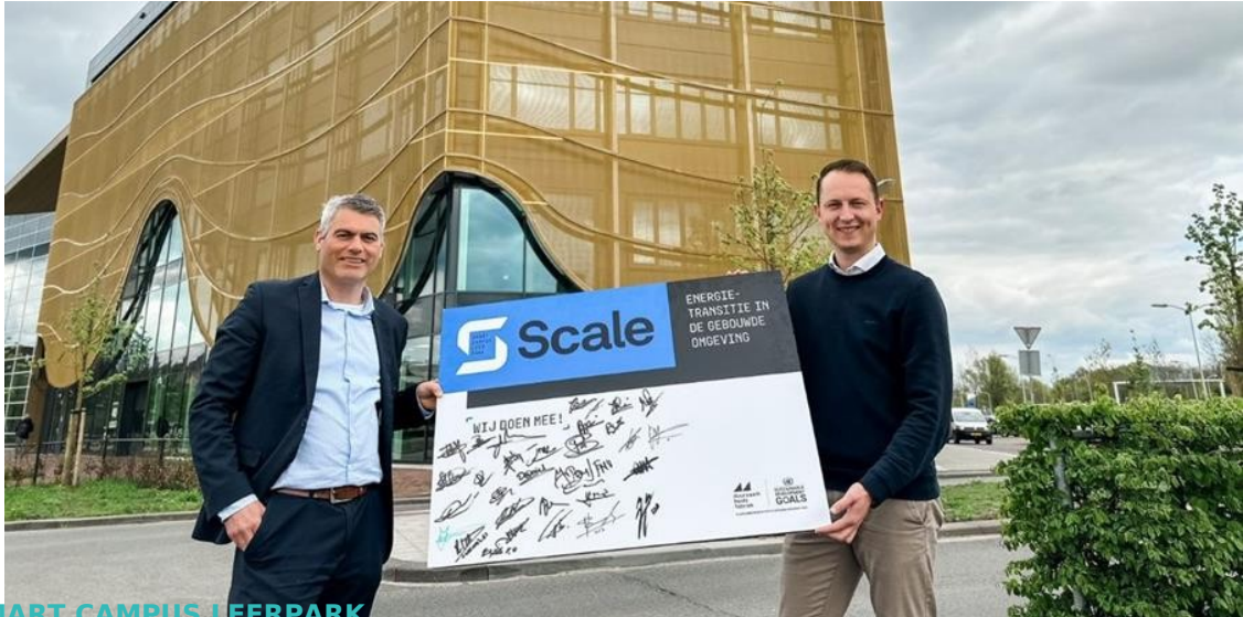
SMART CAMPUS LEERPARK