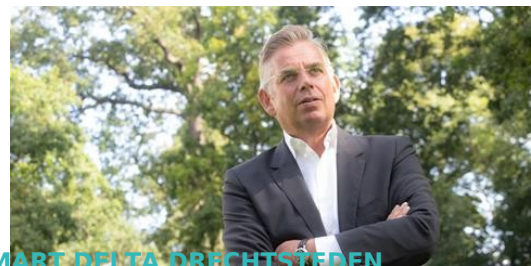
SMART DELTA DRECHTSTEDEN

In juni start in Delft een nieuwe challenge voor Young Professionals. Het bedrijf Festo,