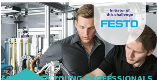
DRECHTSTEDEN YOUNG PROFESSIONALS