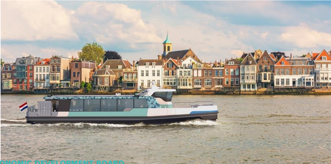
ECONOMIC DEVELOPMENT BOARD