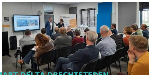
SMART DELTA DRECHTSTEDEN