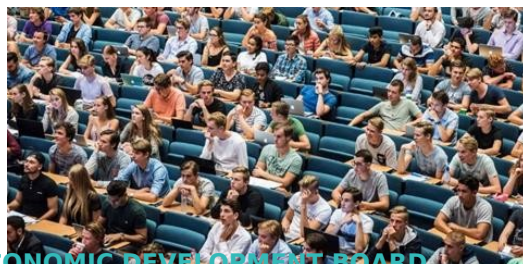
ECONOMIC DEVELOPMENT BOARD

VHB Assetmanagement heeft een kantoor van transformatieproject FORWRD gekocht. In dit complex is plek voor zes bedrijven, waarvan er nu vijf zijn verkocht. Herkon Projectontwikkeling leidt de bouw op het bedrijventerrein Nijverwaard. VHB is een adviesbureau voor duurzaam beheer en onderhoud van gebouwen en wegen.