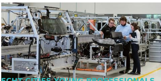
DRECHT CITIES YOUNG PROFESSIONALS