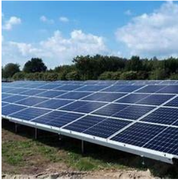
Zon op Veld

Binnen de Regionale Energie Strategie Midden-Hollanc (RES M-H) wordt niet alleen ingezet op zonnepanelen daken maar ook op opwekking van zonne-energie op het veld. Hiervoor is het 'Programma Zon op Veld' opgesteld. De kanskaart laat zien in welke gebieden zonnevelden mogelijk zijn. De gebiedsbeschrijvingen geven aan met welke kenmerken initiatiefnemers bij h maken van een plan voor zonnevelden rekening moet houden. Het afwegingskader is een overzicht van de minimale eisen waar een zonneveld aan moet voldoen. Vanaf maandag 26 augustus kunnen er via het platform initiatieven voor zonnevelden worden ingediend. Nieuw het Platform Programma Zon op Veld!