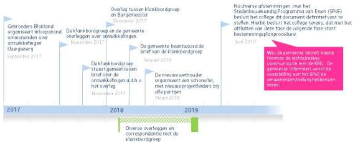
Figuur 2 Tijdslijn IJzergieterij