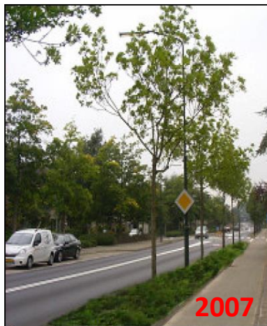
Nieuwe situatie Wieling