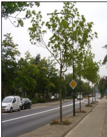
Oude situatie Wieling